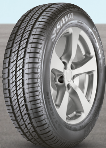
Sava Perfecta 13" bis 15" ab 59 €