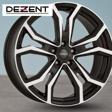
Dezent TV schwarz glänzend frontpoliert 16" bis 20" ab 152 €