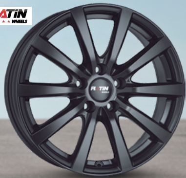
Platin P69 schwarz matt 14" bis 18" ab 99 €