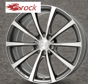
Brock B32 himalaya-grey front-polieret ab 19 Zoll ab 299 € 2

1 Reifenpreise ohne Montage, ohne Wuchten, ohne Felge. 2 Mögliche Kompletttradkombinationen, Felgenpreis zzgl. Reifenpreis zzgl. Montagekosten. Weitere Kompletttrad-Kombinationen möglich.