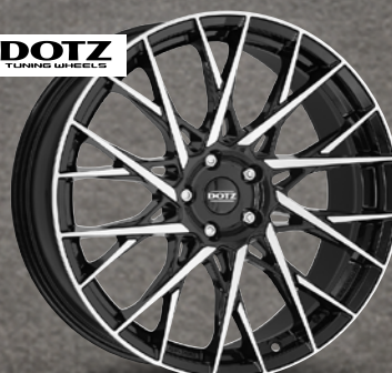
Dotz Fuji dark schwarz glänzend frontpoliert 18" bis 20" ab 225 €