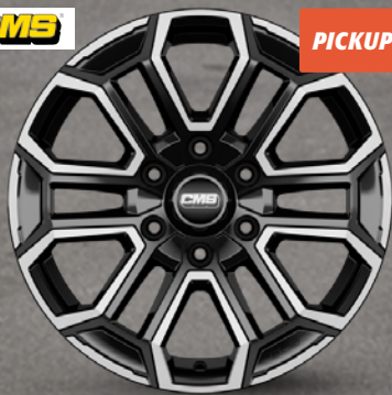
CMS C35 Diamond Black 17" bis 18" ab 154 €