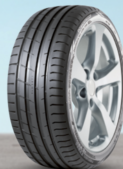
Nokian Powerproof 1 17" bis 20" ab 89 €