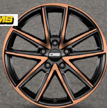
CMS C30 bronze 18" bis 20" ab 189 €