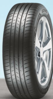
Vredestein Ultrac 15" bis 20" ab 79 €