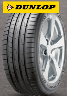
Dunlop Sport Maxx RT 2 ab 18 Zoll ab 109 € 1