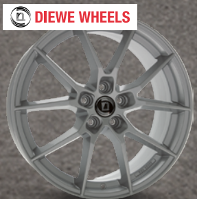
Diewe Alla Argento Silber ab 19 Zoll ab 219 € 2