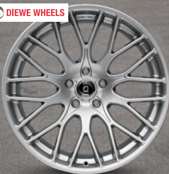
Diewe Impatto Argento Silber 18" bis 22" ab 156 €