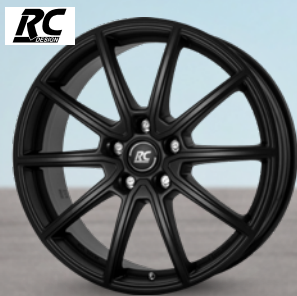
RC-Design RC32 satin-black matt lackiert ab 16 Zoll ab 109 € 2