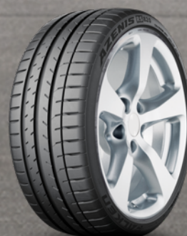
Falken AZENIS RS820 19" bis 21" ab 149 €