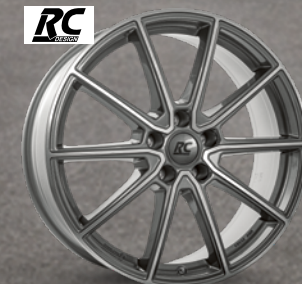
RC-Design RC32 himalaya-grey voll-poliert ab 18 Zoll ab 179 € 2