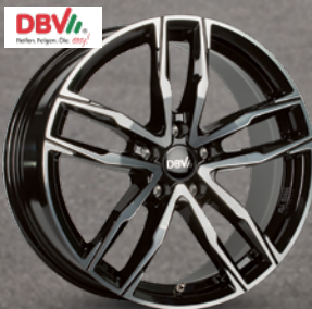
DBV Vienna II schwarz glänzend front poliert ab 18 Zoll ab 156 € 2