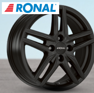
Ronal R65 Jetblack-matt ab 16 Zoll ab 112 € 2