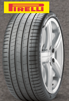
Pirelli P-ZERO (PZ4) ab 19 Zoll ab 176 € 1