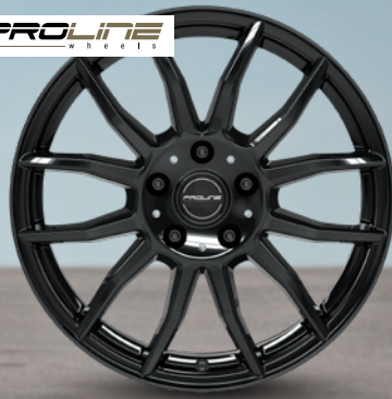
Proline AX100 black glossy 16" bis 17" ab 109 €