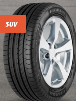
Fulda EcoControl SUV 17" bis 21" ab 115 €