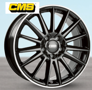
CMS C23 Diamond Rim Black ab 16 Zoll ab 115 € 2