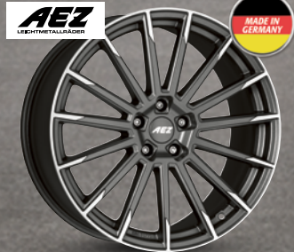
AEZ Atlanta titan graphit matt poliert ab 18 Zoll ab 249 € 2