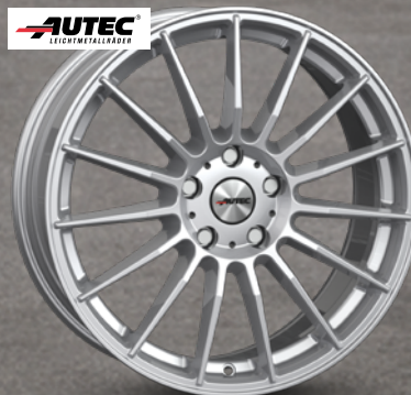
Autec Lamera hyper silber 17" bis 20" ab 159 €