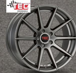
TEC Speedwheels GT7 gunmetal ab 19 Zoll ab 247 € 2