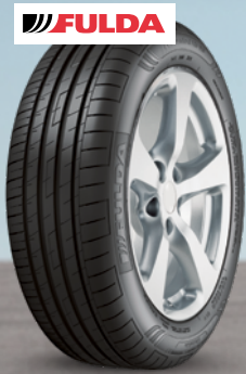
Fulda EcoControl HP2 ab 16 Zoll ab 79 € 1